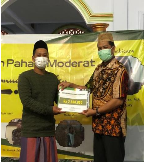
Gambar 5. Penyerahan Dana Program