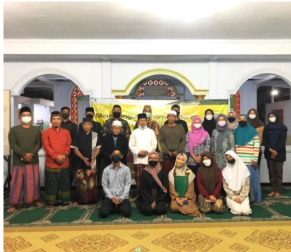
Gambar 6. Foto Bersama Tim &amp; Peserta

Kegiatan Pengabdian Kepada Masyarakat (PKM) yang diselenggarakan atas kerjasama antara Tim Pengabdian UMY dengan Pemuda dan Pemudi Klidon Mantren berjalan dengan sukses. Setelah sesi foto bersama sebagai dokumen penyelenggaraan kegiatan, Tim Pengabdian beserta Kepala Pedukuhan Klidon, tokoh masyarakat, tokoh agama, dan pemuda-pemudi masih melanjutkan diskusi santai mengenai tindak lanjut program penguatan paham moderasi pada waktu yang akan datang.