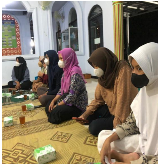
Gambar 2. Pemudi Menyimak Materi

Kedua , tanya jawab. Membuka kesempatan kepada seluruh pemuda untuk mengajukan pertanyaan atau komentar mengenai moderasi beragama. Di antara pemuda, ada yang menanyakan mengenai sikap bergaul dengan pemeluk agama lain. Menurutnya, keberadaan tetangga yang berbeda agama tidak mungkin dianggap sebagai sesuatu yang berbahaya. Sebab, mereka juga makhluk ciptaan Tuhan yang diberi sejumlah hak yang sama dengan makhluk atau manusia lainnya. Ada pula di antara mereka bertanya mengenai esensi moderasi beragama itu sendiri. Baginya, sangat sulit menanggapi berbagai peristiwa dengan tidak memihak. Sebagai seorang