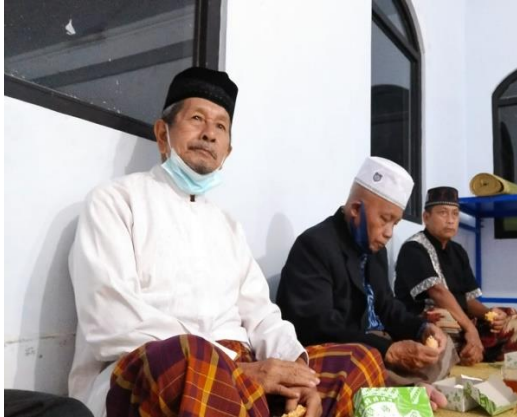
Gambar 3. Suasana Pengajian/Ceramah

muslim misalnya, apakah klaim bahwa hanya agama Islamlah yang paling benar dianggap salah? Lalu, bagaimana sikap sebagai seorang muslim yang baik terkait dengan hal ini agar orang lain (pemeluk agama lain) tidak marah? Demikian beberapa pertanyaan yang muncul dari para peserta (pemuda-pemudi). Dokumentasi kegiatan dapat dilihat pada Gambar 3 dan Gambar 4.