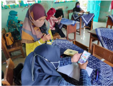
Gambar 1. Pemateri mendampingi praktek pembuatan video animasi dengan Canva

kegiatan yang sudah dilakukan di lapangan.