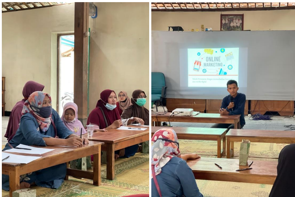
Gambar 1. Suasana Penyuluhan Marketing Online

Penyuluhan marketing online bertujuan untuk meningkatkan pemahaman dari mitra usaha terkait pemasaran secara online . Karena dimasa sekarang ini, pemasaran secara online merupakan salah satu cara yang efektif untuk meningkatkan omzetnya. Kegiatan ini dilakukan secara offline dan dengan mematuhi protokol kesehatan. Penyuluhan diawali dengan pelaksanaan pretest untuk mengetahui pemahaman awal dari mitra terkait pemasaran online .