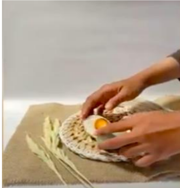
Gambar 2. Pendampingan Pembuatan Foto Produk Telur Asin