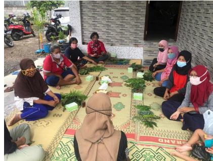
Gambar 3. Kegiatan penyuluhan nilai ekonomi sampah daun

tidak memiliki potensi nilai ekonomi. Dengan inovasi dan kreativitas, yakni dengan memanfaatkan daun sebagai materi untuk membuat batik yakni menjadikan daun sebagai motif corak batik ecoprint , secara tidak langsung Ibu-Ibu PKK mengetahui dan akan menyadari adanya potensi nilai ekonomi pada daun dan dengan memanfaatkan daun tersebut akan mendukung upaya kebersihan lingkungan. Dokumentasi penyuluhan nilai ekonomi sampah daun disajikan pada gambar 3 .