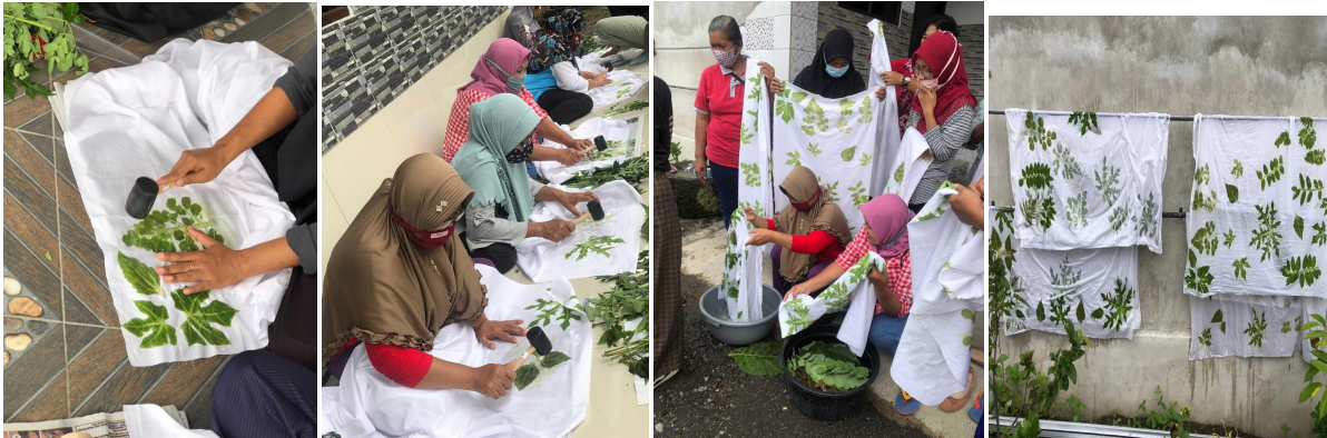
Gambar 5. Metode pukul batik ecoprint

Metode batik ecoprint ada 2, yaitu metode pukul dan metode kukus. Metode pukul, maksudnya adalah penempelan motif dan warna daun di atas kain mori dengan cara dipukul-pukul, hingga pukulannya di atas kain mori menyerupai daun, seperti tampak pada gambar 5 . Dedaunan yang bisa dipergunakan antara lain: daun kelor, daun jarak, daun katuk, daun papaya Jepang, daun pakis, daun lanang, daun skrikaya, daun sawur mabur. Setelah proses memukul daun selesai, kain dicelupkan di dalam campuran air tawas 1 liter dan 1 sendok makan tawas. Selanjutnya, kain dijemur hingga kering. Setelah kering, kain siap dipergunakan untuk berbagai kreasi, seperti tampak pada gambar 6 . Warna motif pada kain tetap berwarna hijau seperti warna daun aslinya.