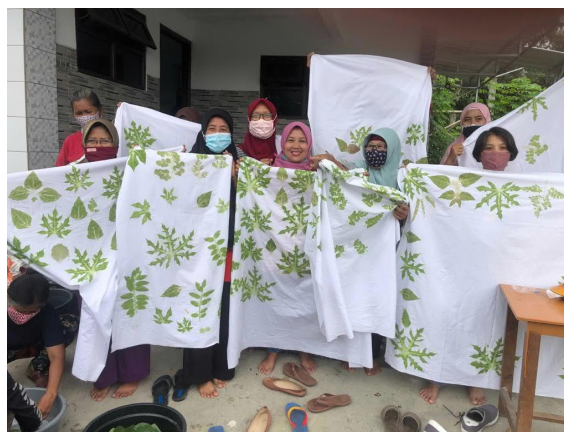
Gambar 6. Hasil kain batik ecoprint metode pukul

Metode kukus, pertama-tama yang dilakukan adalah merendam dedaunan dalam campuran air dan cuka atau campuran air dan tanjung. Dedaunan yang bisa dipergunakan untuk metode kukus ini antara lain: daun jati muda, daun jarak, dan daun ketapang kecil. Selanjutnya susun daun di atas kain mori hingga ke seluruh permukaan kain mori, lalu seluruh permukaan kain ditutup