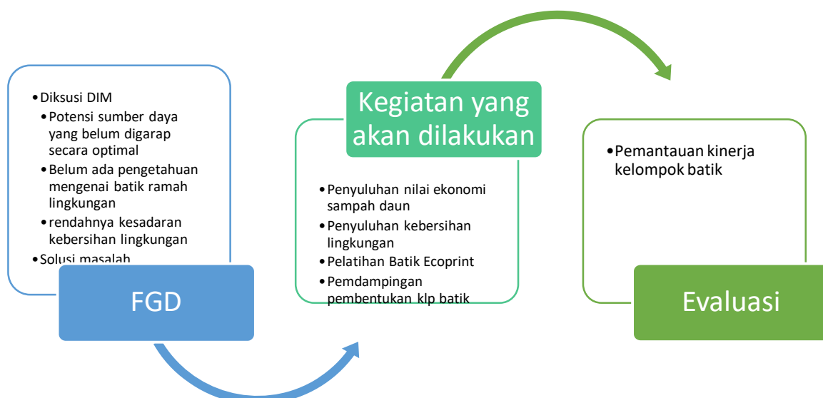
Gambar 2. Metode pelaksanaan