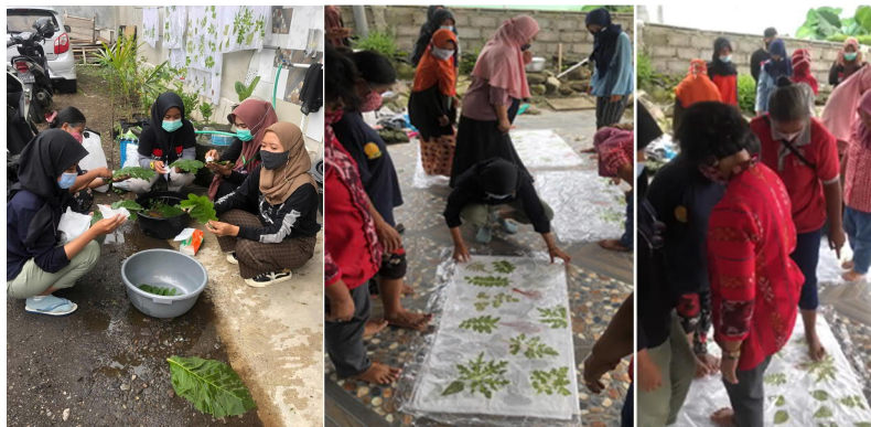
Gambar 7. Proses batik ecoprint metode kukus

dengan plastik. Setelah itu, kain dilipat menjadi dua bagian, lalu diinjak-injak. Lipat lagi menjadi lebih kecil dan diinjak-injak lagi. Selanjutnya, dilipat terus hingga sampai pada lipatan yang terkecil dan diinjak-injak hingga daun menempel sempurna pada kain. Lipatan kain yang terakhir diikat dengan tali rafia, selanjutnya kain dikukus selama 3 jam. Setelah 3 jam, kain diangkat lalu dijemur hingga kering. Proses batik ecoprint dengan metode kukus disusun pada gambar 7 . Selanjutnya, kain siap dipergunakan untuk berbagai kreasi, seperti tampak pada gambar 8 . Setelah dikukus, warna daun pada kain berubah menjadi beberapa warna, misalnya daun sawur mabur dari warna hijau cerah berubah menjadi hijau tua; daun lanang dari warna hijau tua berubah menjadi warna oranye; daun jarak dari warna hijau berubah menjadi warna kuning; dan yang paling bagus adalah daun cajati muda dari warna hijau muda berubah menjadi warna merah tua keunguan.