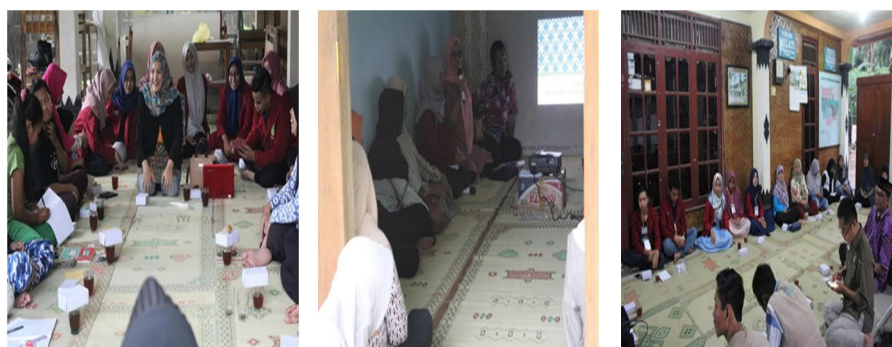
Gambar 4. Penyuluhan kebersihan lingkungan

Kegiatan penyuluhan kebersihan dilakukan secara terbatas, dengan peserta yang diundang hanya sekitar 15 orang sebagaimana tampak pada gambar 4 .