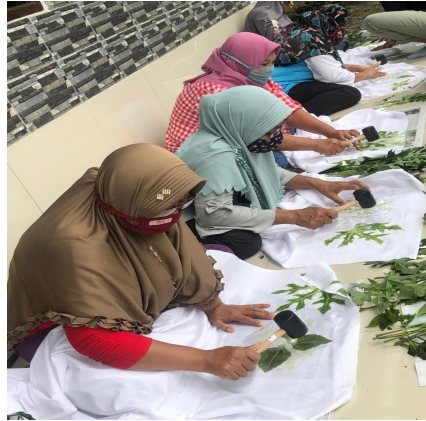
Gambar 1. Penempelan motif daun pada kain mori