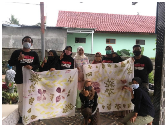
Gambar 8. Hasil kain batik ecoprint metode kukus