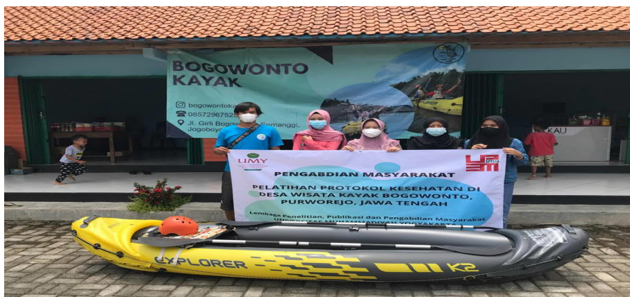
Gambar 2. Dokumentasi Pelaksanaan Pengabdian Di Desa Wisata Kayak Bogowonto, Purworejo

Keterangan: P (Perempuan); L (Laki-laki)