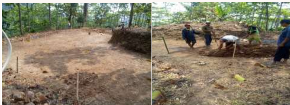
Gambar 3. Dalam tahap penggalian tanah seluas tujuh hektar yang akan digunakan sebagai wisata desa di daerah Jembul

Tidak hanya air terjun Coban Kabegjan yang menjadi obyek wisata di daerah Desa Jembul, Kecamatan Jatirejo, Kabupaten Mojokerto. Di daerah Desa Jembul juga akan di bangun kurang lebih sembilan atau delapan wahana out bond di atas Tanah Kas Desa (TKD) seluas kurang lebih tujuh hektar yang telah ada kesepatan Kepala desa dengan masyarakatnya yang nantinya semua warga Desa Jembul dapat menikmati dari pembangunan obyek wisata out bond . Saat ini obyek wisata out bond di Desa Jembul masih dikerjakan oleh warga di Desa Jembul, berikut adalah penggarapan obyek wisata out bond di Desa Jembul di atas tanah seluas tujuh hektar.