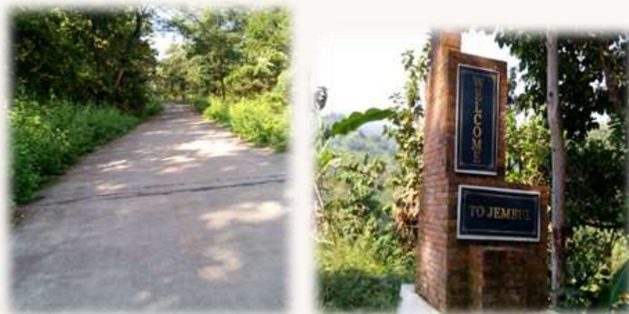
Gambar 1. Jalan menuju di Desa Jembul dan gapura masuk di Desa Jembul.

Masyarakat Desa Jembul yang berpenghuni 309 jiwa ini banyak menggantungkan hidupnya dari hutan. Desa ini hanya terdiri dari satu dusun yaitu dusun Jembul dan terbagi dalam empat Rukun Tetangga (RT) dan dua Rukun Warga (RW), mayoritas bermata pencaharian sebagai petani dan buruh tani. Meskipun demikian, pola pertanian mereka tetap memanfaatkan lereng-lereng hutan sebagai penghasilan utama. Hamparan Desa Jembul yang masih hijau ini sangat mudah untuk dijangkau melalui Desa Manting. Karena letaknya yang dikelilingi perbukitan dengan ketinggian 500 meter diatas permukaan air laut (mdpl), tidak heran jika sarana komunikasi di Desa Jembul kurang maksimal. Hanya provider tertentu yang dapat menjangkau sinyal ke pelosok desa ini. Untuk akses jalan sudah nyaman dilewati karena sudah dicor untuk menuju di Desa Jembul, Kecamatan Jatirejo, Kabupaten Mojokerto.