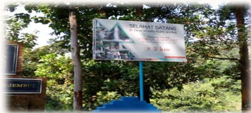
Gambar 2: Selamat Datang Air Terjun Coban Kabegjan Desa Jembul Kecamatan Jatirejo Kabupaten Mojokerto

Tidak hanya air terjun Coban Kabegjan yang menjadi obyek wisata di daerah Desa Jembul, Kecamatan Jatirejo, Kabupaten Mojokerto. Di daerah Desa Jembul juga akan di bangun kurang lebih sembilan atau delapan wahana out bond di atas Tanah Kas Desa (TKD) seluas kurang lebih tujuh hektar yang telah ada kesepatan Kepala desa dengan masyarakatnya yang nantinya semua warga Desa Jembul dapat menikmati dari pembangunan obyek wisata out bond . Saat ini obyek wisata out bond di Desa Jembul masih dikerjakan oleh warga di Desa Jembul, berikut adalah penggarapan obyek wisata out bond di Desa Jembul di atas tanah seluas tujuh hektar.