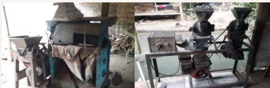
Gambar 6. Mesin-mesin produksi kopi

Namun, diatas semua ini baik pihak koperasi maupun petani merasa sangat membutuhkan pendampingan untuk pemasaran produk kopi jenis baru ekselsa ini menjadi produk unggulan daerahnya dan dikenal di luar daerah desa Jembul. Baik koperasi maupun kelompok tani kopi ini juga menginginkan adanya pembinaan terhadap pengemasan dan membuat merk dagang yang menarik bagi produk kopi mereka. Pihak koperasi dan petani kopi desa Jembul sangat ingin berkembang dan mengembangkan produk mereka ini dan berharap produk kopi jenis baru ini bisa menjadikan daerah mereka lebih maju.