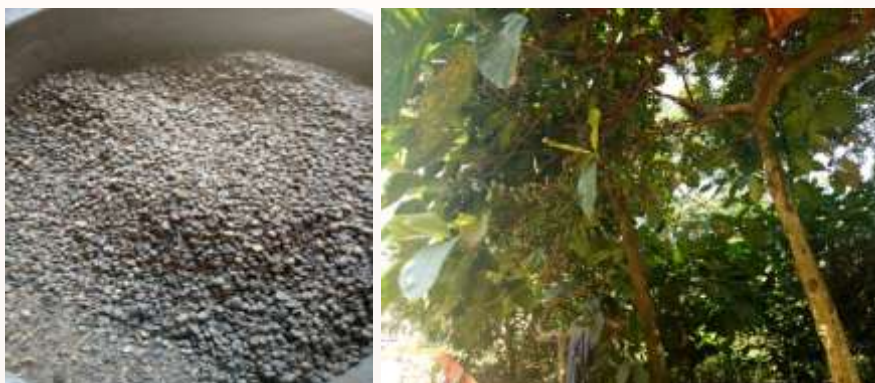
Gambar 4. Desa Jembul sebagai penghasil kopi

Dalam budidaya kopi, masyarakat dapat memperoleh keuntungan yang signifikan jika dalam proses panen hingga pemasaran dilakukan sendiri tanpa membayar buruh untuk memetik kopi. Jika menggunakan buruh pemetik kopi, maka akan menambah upah buruh sebesar Rp.25.000 – Rp.30.000. Jika dihitung dengan total pendapatan penghasilan kopi secara keseluruhan, tidak jarang pemilik kopi justru akan merugi. Lahan yang akan ditanami harus dipersiapkan dan disterilkan. Proses sterilisasi dari rumput-rumput liar adalah syarat mutlak ketika akan menanam bibit kopi. Jika tidak dibersihkan, maka rumput akan mengganggu perkembangan bibit.