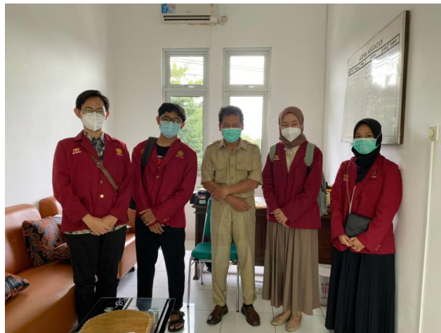
Gambar 13. Pamitan ke Puskesmas Kasihan 1

Penyerahan data comorbid masyarakat jipangan diserahkan kepada puskesmas untuk dokumentasi dan catatan. Pamitan tim pengabdian kepada puskesmas dilakukan karena telah selesai pengabdian seperti pada gambar 13.