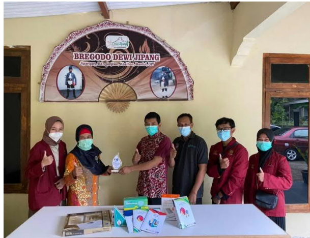
Gambar 12. Penyerahan Barang Hibah kepada Jukuh jipangan dan Utusan Puskesmas Kasihan 1

Penyerahan hibah berupa alat pengukur tekanan darah, pengukur berat badan, tinggi badan, masker cuci ulang, masker sekali pakai untuk dewasa dan anak, masker anak berkarakter, dimaksudkan untuk meningkatkan kewaspadaan agar tidak tertular covid terutama untuk masyarakat yang memiliki komorbid dan masyarakat rentan seperti anak-anak dan lansia.