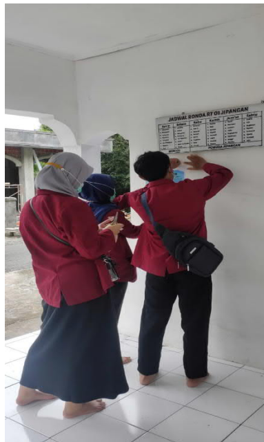
Gambar 9. Penempelan Poster Cegah Covid di Pos Ronda