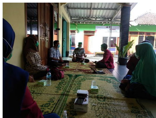
Gambar 5. Fokus Grup Discussion Mantan Isoman

Adapun peserta mantan isoman adalah sebagai berikut.