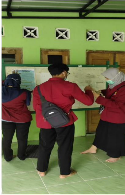
Gambar 8. Penempelan Poster Cegah Covid di Papan Pengumuman