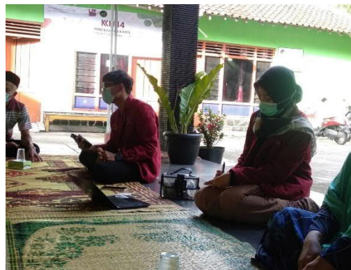
Gambar 5. Fokus Grup Discussion Mantan Isoman

Kegiatan focus group discussion pada mantan isoman ini dilakukan untuk mengetahui kebutuhan isoman yang sebenarnya sehingga jika ada yang isoman akan lebih efektif dalam pendampingannya. Sebagaimana pada gambar 5 dan 6 berikut.