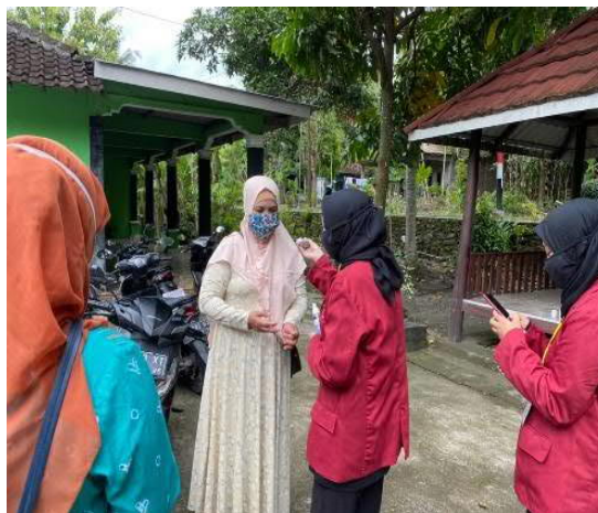
Gambar 1. Penyuluhan Dimulai dengan Pemeriksaan Suhu Badan

Penyuluhan tentang penyakit tidak menular (PTM) terutama diabetes melitus dan hipertensi dilakukan, mengingat penduduk Jipangan kebanyakan mengalami hal ini. Penting untuk dilakukan dengan sasaran kader kesehatan dan kader PKK. Kader PKK juga diharapkan menjadi kader kesehatan terutama di era covid, mengingat kondisi ini menyebabkan kegiatan pemeriksaan kesehatan rutin sebulan sekali di posyandu lansia tidak dilakukan. Sementara itu, kondisi kesehatan lansia harus terus-menerus dipantau minimal sebulan sekali. Oleh karena itu, dengan adanya kader PKK yang dilatih dengan penyuluhan PTM akan mampu membantu memantau kesehatan warga sekitar Jipangan tempat kader PKK itu tinggal. Kegiatan ini dihadiri oleh 16 peserta. Pelaksanaan penyuluhan dengan protokol covid dimulai dengan pemeriksaan suhu badan dan duduk berjarak. Sebagaimana terlihat pada gambar 1, gambar 2, dan gambar 3.