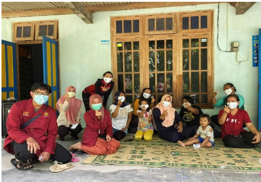
Gambar 11. Pembagian Hibah Masker dari Dikti

Pembagian masker ke masyarakat dilakukan sebagai kepedulian akan pencegahan tertular covid dan pembiasaan bermasker, terlebih saat keluar rumah. Sebagaimana gambar 11 tim pengabdian masyarakat membagikan masker gratis dari Dikti dan penegasan untuk selalu digunakan ketika keluar rumah.