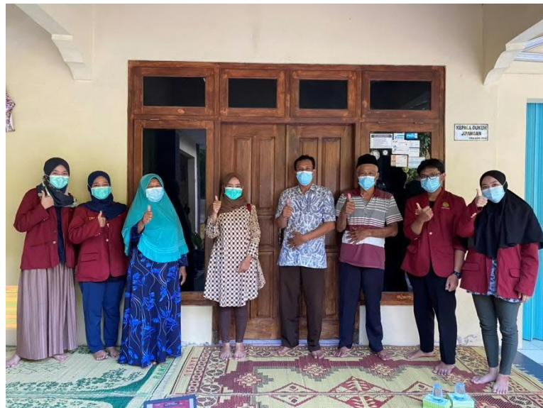
Gambar 7. Diskusi Bersama Penyintas Isoman, Keluarga, Pihak Dukuh, dan Pihak Puskesmas