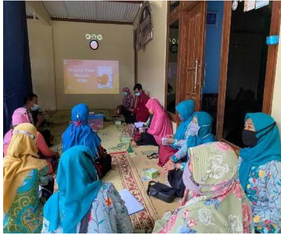
Gambar 2. Penyuluhan Dilaksanakan dengan Duduk Berjarak