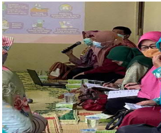
Gambar 3. Kegiatan Penyuluhan tentang PTM (Penyakit tidak Menular)

Pelaksanaan penyuluhan ini dilakukan pretest dan posttest untuk mengetahui sejauh mana serapan materi oleh peserta . Adapun hasil pretest dan posttest dapat dilihat pada grafik gambar 4 berikut.