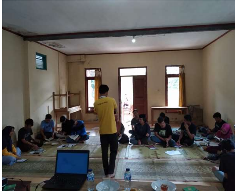
Gambar 1: Suasana peserta kegiatan pengabdian

mahasiswa, sehingga mereka mempunyai semangat dan juga giat dalam belajar. Ketiga, mendekatkan mereka dengan buku dan memberikan pemahaman akan pentingnya membaca dan menulis bagi mahasiswa dalam menghadapi tantangan zaman.