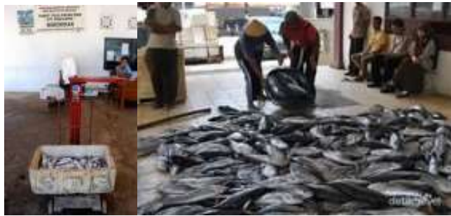
Gambar 1. Hasil ikan melimpah

Pengolahan hasil ikan menambah unggulan desa ini. Namun demikian, potensi tersebut masih mengalami kendala dalam hal pemasaran ( marketing ). Pengolahan ikan ini menjadi nilai tambah Desa Kanigoro dalam meningkatkan perekonomian terutama dalam penyediaan lapangan pekerjaan, sumber pendapatan keluarga. Pengolahan ikan juga memiliki manfaat untuk meningkatkan status kesehatan melalui kecukupan konsumsi ikan supaya mencegah terjadinya malnutrisi, salah satu contohnya adalah stunting (Ngaisyah dan Adiputra, 2018)