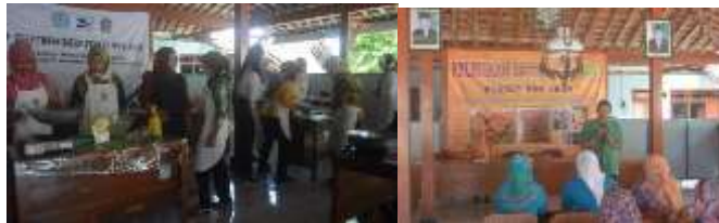
Gambar 3. Pelatihan pada kelompok PKK

Potensi desa Kanigoro sebagai daerah penghasil ikan dapat menjadi peluang mengolah potensi pangan lokal ikan untuk meningkatkan ekonomi keluarga. Hal inilah yang menjadi motivasi tim untuk melakukan kegiatan pengabdian masyarakat. Setelah penandatanganan kesepakatan kerjasama sebagai dasar komitmen dengan mitra, selanjutnya dilakukan kegiatan pelatihan aneka pengolahan ikan. Kegiatan tidak hanya melatih PKK supaya mampu mengolah ikan tetapi juga pelatihan strategi pemasaran supaya mampu meningkatkan jumlah penjualan dan wilayah pemasaran. Kegiatan Pelatihan meliputi strategi pemasaran langsung dan pemasaran online .