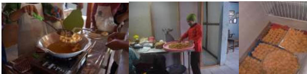
Gambar 2. Aneka pengolahan ikan

Keberadaan Tim Penggerak Pemberdayaan Kesejahteraan Keluarga (PKK) Desa Kanigoro berperan penting pada kegiatan untuk mendukung kapasitas ibu rumah tangga untuk memproduksi aneka olahan ikan. Salah satu kegiatan yang sedang intens tersebut adalah pengembangan produk olahan dari ikan menjadi abon, nugget, crispy ikan, ikan asin dan kerupuk ikan. Sumber pangan lokal ikan yang melimpahpun belum dikelola secara optimal. Sementara ini produksi olahan ikan masih dalam skala kecil, packaging belum menarik dan higienis dan masih terbatasnya pemasaran. Produksi olahan ikan perlu dikembangkan untuk alternatif keanekaragaman makanan sumber protein hewani (lauk pauk).