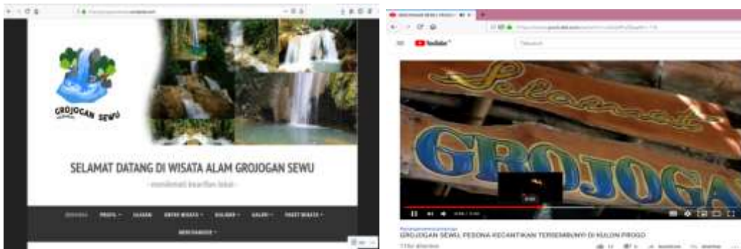
Gambar 3: Website Grojokan sewu dan publikasi melalui channel youtube

wisata Grojokan sewu ini dipandang perlu guna mengenalkan, memasarkan dan memajukan potensi wisata yang ada di Dusun Beteng ini. Dalam hal ini UMY melalui LP3M telah mengutus mahasiswanya melalui program KKN bekerjasama dengan perangkat dusun beteng dalam mengenalkan lokasi wisata tersebut dengan membuat website wisata grojokan sewu, yang kemudian akan dikelola oleh para pemuda karang taruna yang ada di dusun tersebut. Dengan adanya system informasi tersebut diharapkadapat meningkatkan wisatawan yang berkunjung di lokasi grojokan sewu. Masyarakat dapat mengakses langsung website wisata tersebut di alamat: grojokansewukp.wordpress.com . Adapun contoh laman website dan publikasi media social tersebut sebagai berikut: