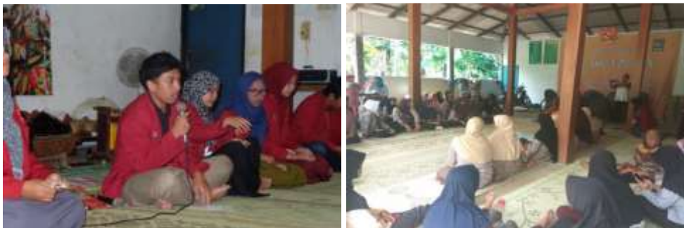
Gambar 1: Penyuluhan terhadap masyarakat di balai dusun Beteng

Pengelolaan pariwisata berbasis masyarakat merupakan pengelolaan wisata yang dilaksanakan dengan melibatkan masyarakat sekitar yaitu dengan cara memberdayakan masyarakat sekitar dengan mengedepankan partisipasi aktif masyarakat dengan tujuan untuk memberikan kesejahteraan bagi mereka dengan tetap menjaga kualitas lingkungan, serta melindungi kehidupan sosial dan budayanya. (Purmada, 2016) Maka memberikan edukasi dan menyadarkan masyarakat dalam pengelolaan lokasi wisata menjadi bagian penting agar warga memahami perannya dalam memajukan desa serta perekonomian masyarakat. Melihat kondisi masyarakat saat ini belum banyak yang mengetahui bagaimana tata cara mengelola tempat wisata baik dari segi pengelolaan tata ruang, marketing, administrasi dan juga perencanaan jangka panjang. Tantangan utama dalam memajukan desa wisata grojokan sewu ini adalah bagaimana semua lapisan masyarakat bisa berperan dan bersinergi secara tepat agar dapat mendatangkan wisatawan yang berkunjung ke lokasi tersebut. Sebab sampai saat ini masyarakat masih belum bisa merasakan hasil daripada adanya lokasi wisata di wilayah mereka. Hal yang demikian itu disebabkan sebagian besar dari mereka masih menjadikan bercocok tanam sebagai mata pencaharian utama mereka sehingga mereka tidak dapat focus terhadap kemajuan desa yang memiliki potensi yang besar dalam sektor wisata.