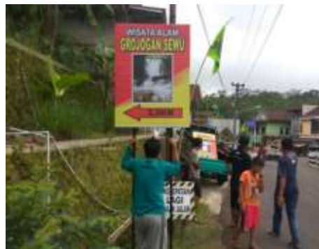
Gambar 2: Siteplan dan petunjuk lokasi wisata Grojoka Sewu