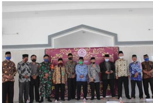
Peresmian bangunan masjid oleh tim pengabdian dan aparat terkait.

apabila berada dan menggunakan masjid tersebut dalam berbagai kegiatan. Kegiatan peresmian masjid dapat dilihat pada Gambar 3.