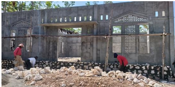
Pengerjaan pembangunan masjid yang dikerjakan oleh warga Dusun Jrasah.

Dari data tersebut, maka diketahui bahwa dusun tersebut belum memiliki masjid sendiri. Maka dari itu, tim pengabdian memiliki ide akan mengadakan pembangunan masjid di daerah tersebut, masjid yang akan dibangun merupakan masjid sederhana, namun sesuai standar, dengan dana yang diperoleh dari tim, mitra, serta warga dusun, untuk pekerja dan tukang dalam pembangunan tersebut semuanya menggunakan tenaga dari warga, sedangkan untuk pengawasnya merupakan orang-orang dari tim pengabdian. Pengerjaan dan pengawasan dalam pembangunan masjid dapat dilihat pada Gambar 1 dan Gambar 2.