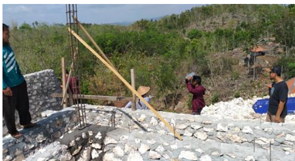
Pengawasan pembangunan masjid yang dilakukan oleh tim pengabdian.