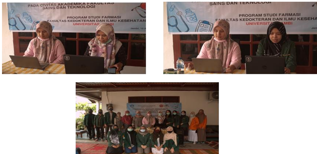
Gambar 1. Kegiatan PPM

Kegiatan PPM dilakukan secara virtual ( online ) dikarenakan situasi pandemi covid-19 yang terjadi di seluruh belahan dunia. Perlu dilakukan penyesuaian adaptasi pelaksanaan kegiatan PPM ini dengan tetap melaksanakan protokol kesehatan Covid-19. Kegiatan PPM ini dilaksanakan dengan kolaborasi mitra dari Himpunan Mahasiswa Farmasi (HIMAFAR) Unja. Kegiatan ini diselenggarakan secara virtual melalui aplikasi ZOOM Cloud Meetings dan live streaming pada channel YouTube http://www.youtube.com/watch?v=OBbgqR5RxH0 yang diikuti oleh 134 peserta yang terdiri atas kalangan mahasiswa, pegawai, tenaga kependidikan, dan dosen. Penyelenggaraan PPM ini bekerjasama dengan Himpunan Mahasiswa Farmasi (HIMAFAR) Fakultas Kedokteran dan Ilmu Kesehatan seperti terlihat pada Gambar 1.