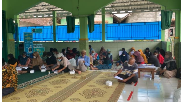
Gambar 1. Suasana pengerjaan soal pre-test oleh masyarakat di dusun Polowidi

pengabdian dimulai dengan mitra sasaran mengerjakan soal pre-test terlebih dahulu. Hal ini bertujuan untuk mengetahui tingkat pengetahuan masyarakat terkait penggunaan obat.