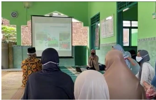
Gambar 2. Edukasi Penggunaan Obat oleh Apoteker AoC

Setiap masyarakat yang datang akan di cek kesehatannya yaitu berupa pengukuran kadar asam urat, kolesterol dan gula darah. Hal ini bertujuan supaya masyarakat dapat mengetahui status kesehatannya dan dapat memahami hal-hal apa saja yang harus dilakukan dan dihindari demi menjaga kesehatan dirinya masing-masing. Program pengecekan kesehatan ini juga di support oleh Apotek Pharm-24 dan AccuCheck.