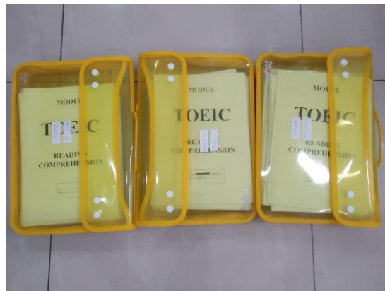
Gambar 2. Modul Reading TOEIC