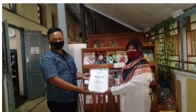
Gambar 4. Serah Terima Modul Pengajaran Reading TOEIC

Dengan berkembangnya pandemi COVID 19 ini, ketua program melakukan upaya alternatif sebagai bentuk penyelesaian program ini. Adapun beberapa opsi yang didiskusikan adalah: (1) mengganti waktu pelaksanaan sampai pandemi ini berakhir, (2) melakukan pelatihan secara online , (3) melakukan program alternatif lain yang masih berfokus pada kemampuan reading TOEIC siswa. Dengan beberapa pertimbangan dan saran yang diberikan oleh guru bahasa Inggris SMK Koperasi, maka program pelatihan reading TOEIC ini dialihkan dengan melakukan pengembangan materi ajar reading TOEIC yang meliputi dua program pokok yaitu pengembangan materi ajar untuk kemampuan membaca dan modul pengajaran TOEIC. Hal ini dimaksudkan untuk memberi guru bahasa Inggris SMK Koperasi bahan ajar TOEIC yang dapat digunakan sewaktu-waktu atau setelah program pelatihan ini berakhir.