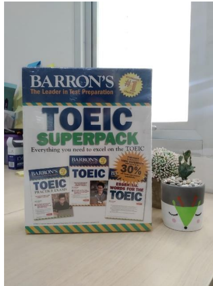
Gambar 5. Modul TOEIC Barron's