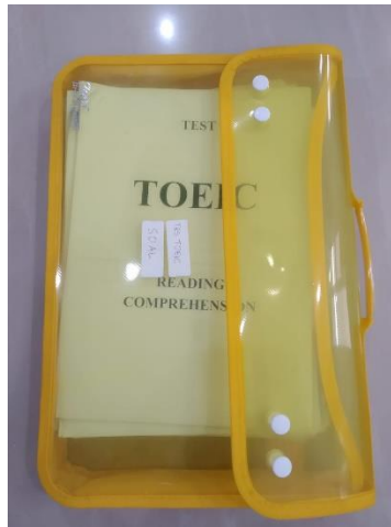
Gambar 1. Soal pre-test reading TOEIC

Partisipan dalam program ini merupakan siswa di tiga kelas jurusan berbeda yaitu jurusan Pemasaran, DKV, dan akuntansi. Dalam pemilihan partisipan, program ini meminta guru bahasa Inggris untuk menentukan kelas yang akan diberikan pelatihan. Karena keterbatasan waktu dan jumlah pengajar, maka hanya tiga kelas yang dipilih yaitu 3 kelas XI di tiga jurusan yang berbeda. Kelas XII tidak dipilih karena pada saat pelatihan, siswa kelas XII sedang mempersiapkan ujian nasional.