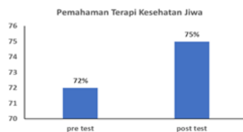
Gambar 6. Pengetahuan dan Pemahaman Ibu-Ibu Purna Pegawai UMY terhadap Terapi Kesehatan Jiwa

Usia lansia memiliki kerentanan dalam kesehatan jiwanya. Risikonya adalah kecemasan, depresi bahkan demensia. Kegiatan pengabdian masyarakat yang dilakukan yaitu memberikan tips kepada ibu-ibu purna pegawai UMY agar mereka dapat menikmati masa lansia dengan bahagia, yaitu melalui silaturahmi, mengikuti perkumpulan-perkumpulan, melakukan aktivitas yang menyenangkan dan melakukan hobi seperti bercocok tanam menggunakan hidrogel. Demensia tidak dapat diobati tapi dapat dicegah dengan cara memfungsikan otak melalui menyibukkan diri dengan berbagai kegiatan. Setelah mengikuti kegiatan ini peserta diharapkan dapat menerapkan tips yang telah diberikan sehingga mereka dapat bahagia di usia lansia. Hasil pre-test dan post-test menunjukkan bahwa terdapat peningkatan pengetahuan dan pemahaman peserta terhadap terapi kesehatan jiwa sebesar 3% dari 72% menjadi 75% (Gambar 6).