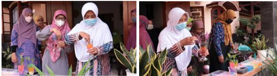
Gambar 3. Praktik Seni Bertanam Modern Menggunakan Hidrogel Sebagai Media Tanam

ini meliputi wadah gelas aneka bentuk, hidrogel yang telah direndam dalam larutan unsur hara serta tanaman. Seni bertanam modern ini diharapkan menjadi alternatif kegiatan bermanfaat bagi ibu-ibu purna pegawai UMY.