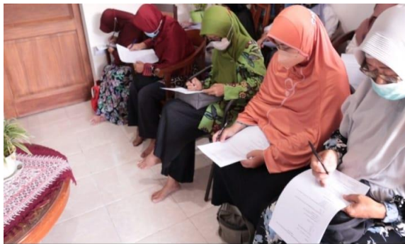
Gambar 1. Peserta Sedang Serius Mengisi Soal Pre-Test , Terapi Kesehatan Jiwa, dan Seni Bertanam Modern

Kegiatan diawali dengan pre-test untuk mengetahui kemampuan awal dari peserta terhadap kesehatan jiwa dan seni bertanam modern. Tiap peserta diminta menjawab pertanyaan-pertanyaan terkait jati diri, pengetahuan dan praktik tentang terapi kesehatan jiwa dan seni bertanam modern.