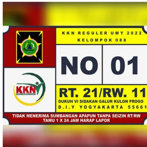
Gambar 2 Penomoran Rumah

format KK serta melakukan pemetaan Dusun Sidakan. Adapun output program penomoran rumah adalah sebagai berikut: