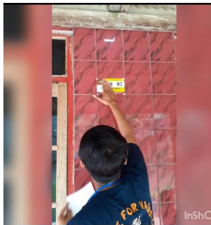
Gambar 3 Proses Pemasangan Penomoran Rumah

Proses dalam penomoran rumah hal yang dilakukan pertama yaitu, dilihat dari masalah yang berada dilapangan mengenai banyaknya data yang tidak sama dengan data yang ada saat ini (setelah tim melakukan observasi pendataan secara langsung) seperti, adanya pembangunan rumah baru yang belum terdata serta banyaknya KK tempel yang belum terdata. Kedua, beberapa rumah yang masih memiliki lokasi yang tidak sesuai dengan RT nya masing-masing. Oleh karena itu tim meminta bantuan kepada setiap masing-masing ketua RT yang bersangkutan untuk membantu proses pendataan di setiap RT nya.